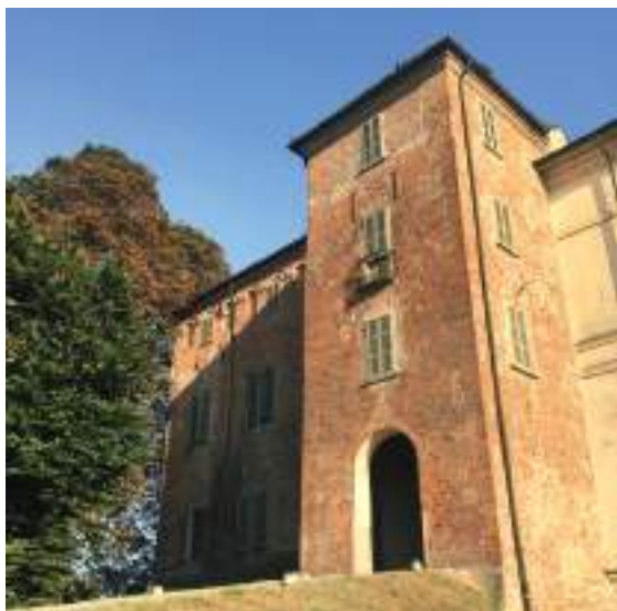
Somaglia en Cavazzi Castle fr Château Cavazzi it Castello Cavazzi

En retournant le long de la digue principale du Pô, le chemin se poursuit en direction du hameau de Valloria, un havre de paix au cœur du territoire de la commune de Guardamiglio. A proximité de la digue, dans le centre de Guardamiglio, se trouve le Palais Zanardi Landi, un édifice majestueux avec son ancienne tour en briques apparentes datant de 1560. A l'intérieur, elle abrite une collection permanente d'œuvres d'art inspirées par la Via Francigena. Au contraire, si l'on continue le long de la digue, on peut faire un petit détour avant d'arriver à la passerelle piétonne et cyclable sur le Pô qui mène à Plaisance ; on arrive à Mezzana Casati, un petit hameau sur le territoire de S. Rocco al Porto, où l'on peut visiter l'église S. Pietro. Bâtie autour de 1573, elle a un plan en croix latine à nef unique, avec deux chapelles situées dans les bras du transept et un chœur surélevé. L'édifice est couvert de voûtes d'arêtes. Niché au cœur de la campagne, c'est un petit joyau de l'architecture religieuse.