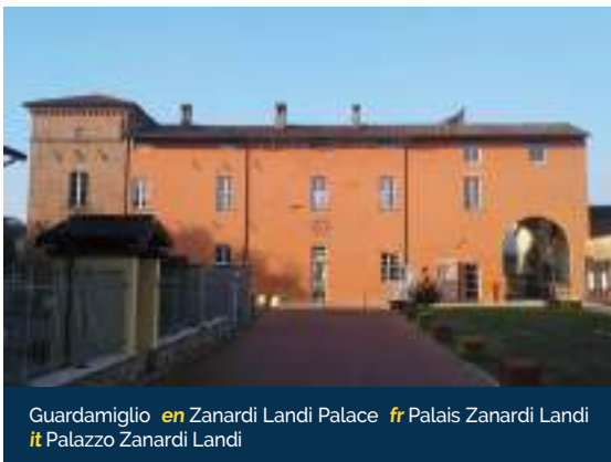
Guardamiglio en Zanardi Landi Palace fr Palais Zanardi Landi it Palazzo Zanardi Landi

Percorrendo l'argine maestro e proseguendo verso la foce, si arriva al Gargatano, località in comune di Somaglia, da cui si gode un panorama fluviale e naturalistico molto suggestivo. Allontanandosi di pochi chilometri dall'argine si giunge nel centro di Somaglia dove campeggia l'imponente Castello Cavazzi: costituito da un volume architettonico modificato nei secoli, fu sicuramente ricostruito nel XIV secolo su fondamenta che potrebbero risalire all'anno 1000. Per gli amanti della natura si segnala nelle vicinanze la Riserva Naturale Monticchie, che si estende per 250 ettari con pregi naturali e presenza di fauna.