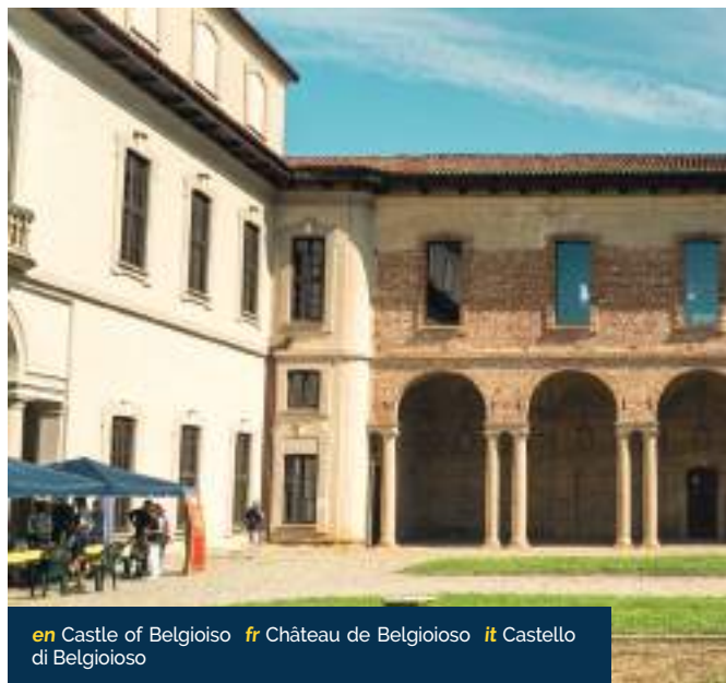
en Castle of Belgioioso fr Château de Belgioioso it Castello di Belgioioso

Per la Provincia di Pavia la Via Francigena, che nel 2004 è stata dichiarata dal Consiglio d'Europa "Grande Itinerario Culturale Europeo", nel 2007 "Reseau porteur", rete portante, costituisce naturalmente un modello di riferimento nella valorizzazione e nel recupero architettonico e ambientale del patrimonio artistico e culturale: è una risorsa