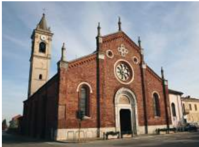
Palestro en San Martino Church fr Eglise San Martino it Chiesa di San Martino

In the Pavia section, where thousand-year-old basilicas, centuries-old knowledge, unspoiled nature and traditional agriculture coexist, pilgrims heading to – or coming back from – Rome will find here countless opportunities for relaxation and spiritual reflection.