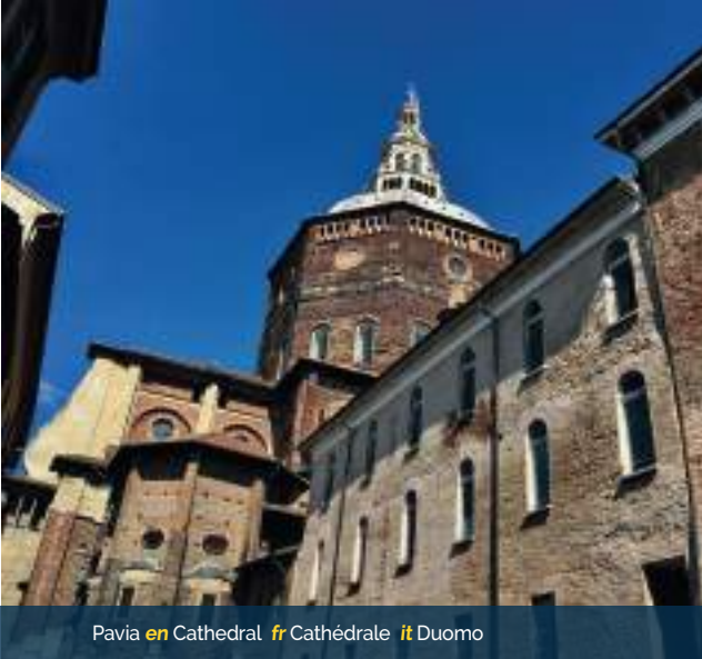
Pavia en Cathedral fr Cathédrale it Duomo