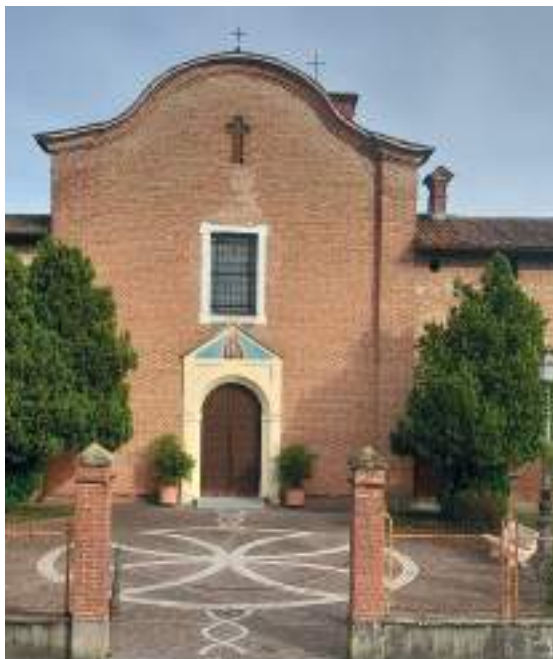
San Rocco al Porto en Church fr Eglise it Chiesa S. Pietro Apostolo - Mezzana Casati.

La Chiesa, costruita intorno al 1573, ha una pianta a croce latina ad unica navata, due cappelle poste nei bracci del transetto e un presbiterio rialzato, il tutto coperto da volte a crociera. Inserito in un contesto totalmente rurale è un piccolo gioiello di architettura religiosa.