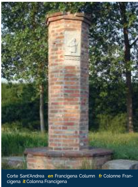
Corte Sant'Andrea en Francigena Column fr Colonne Francigena it Colonna Francigena

Tout près, à Senna Lodigiana, on peut visiter l'église S. Maria in Galilea. L'édifice, reconstruit dans la première moitié du XVIe siècle, se caractérise par l'élévation de la façade et la grande baie géminée dans l'ordre supérieur. En longeant la digue principale vers l'embouchure, on arrive à Gargatano, sur le territoire de Somaglia, qui offre un panorama fluvial et naturel très évocateur. Il suffit de s'éloigner de quelques kilomètres de la digue pour arriver dans le centre-ville de Somaglia, dominé par l'imposant château Cavazzi : certainement reconstruit au XIVe