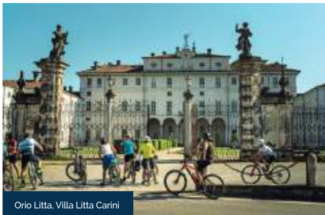
Orio Litta, Villa Litta Carini